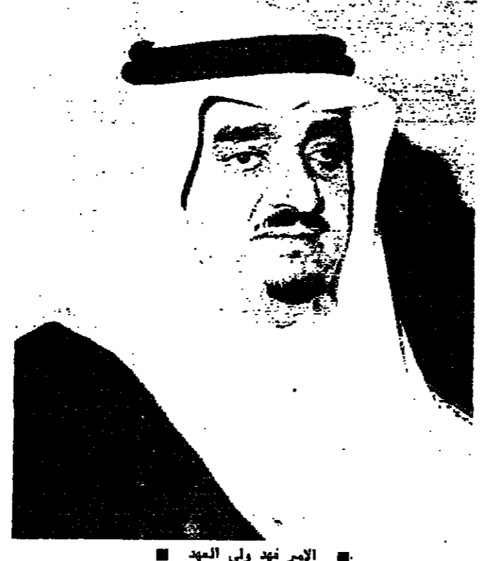
الأمير فهد ولي العهد

تطوعت بتنفيذ شخصية مهزوزة... فالأمير فيصل بن مساعد شاب منحل، يخفي في أعماقه تفصلا رجحيا، وهو يحمل حملا شخصيا، ومشوش الفكر، ومشبه بالاتصالات... يعاني من تورط مالي تجعله سهل الابتزاز.